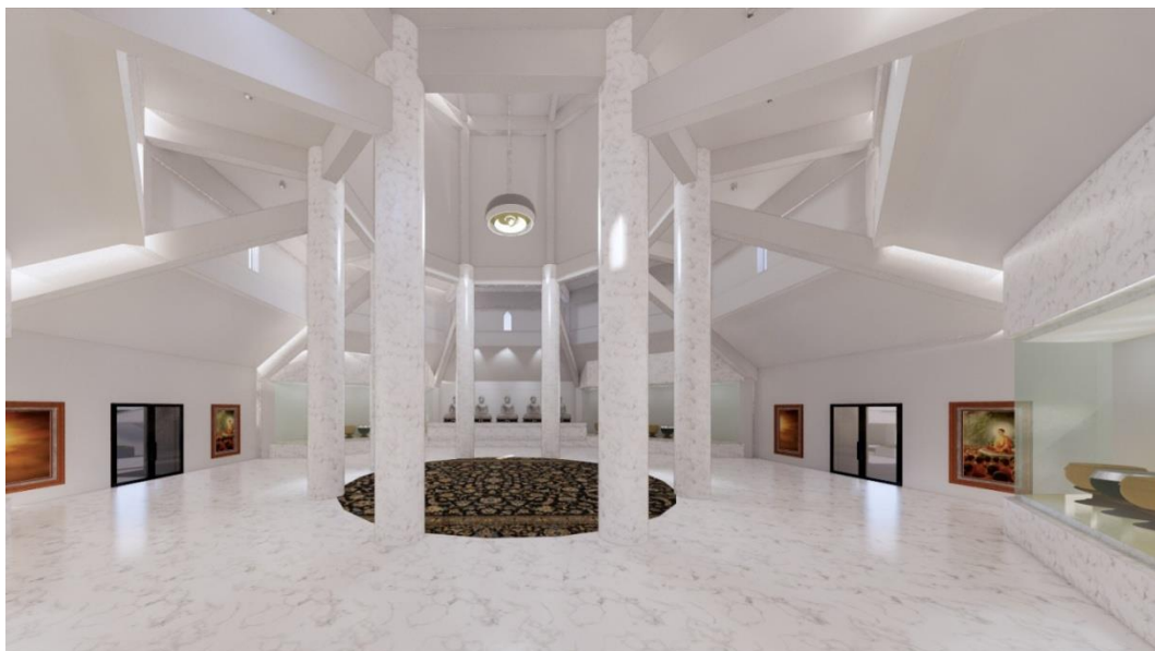
ภาพที่ 6: แสดงทัศนียภาพภายในของอาคารอนุสรณ์สถานพระเทพวิทยาคม