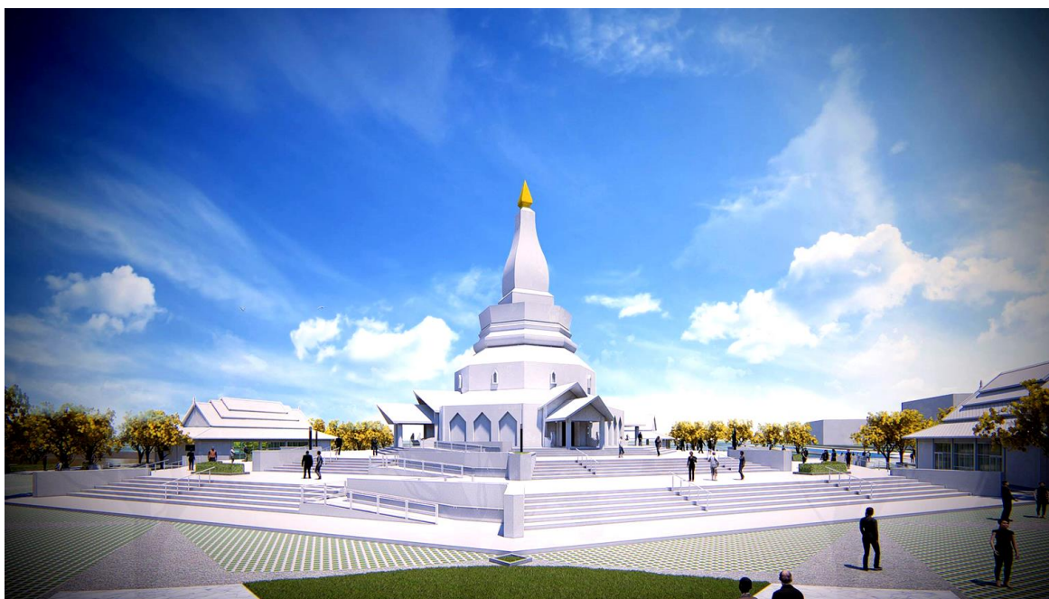
ภาพที่ 1: แสดงทัศนียภาพอาคารอนุสรณ์สถานพระเทพวิทยาคม (หลวงพ่อคุณ ปริสุทโธ)

อาคาร ‘อนุสรณ์สถานพระเทพวิทยาคม’ มีลักษณะเป็นอาคารคอนกรีตเสริมเหล็กความสูง 32 เมตร บนฐาน 8 เหลี่ยมด้านเท่าด้านละ 9 เมตร มีซุ้มจตุรมุขทั้งหมด 4 ด้าน ศาลารายจำนวน 3 หลังโดยรอบ มีพื้นที่ใช้สอยรวม 1,000 ตารางเมตร โดยกำหนดที่ตั้ง ณ พุทธมณฑลอีสาน อำเภอเมืองขอนแก่น จังหวัดขอนแก่น มีลักษณะรูปแบบวัฒนธรรมประยุกต์ จากรูปแบบของพระธาตุในกลุ่มวัฒนธรรมไต-ลาว ที่เรียกกันว่า ‘ทรงบัวเหลี่ยม’ ที่เป็นการจำลองลักษณะของเขาสระมูลตามคติไตรภูมิโดยมีการปรับปรุงรูปแบบให้มีความร่วมสมัยมากขึ้น โดยการลดทอนการตกแต่งประดับประดาให้เกิดความเรียบง่าย สมถะ และสันโดษ และโดยการใช้สีขาวเป็นหลักของอาคารผนวกเข้ากับการใช้แสงธรรมชาติภายในอาคารเพื่อส่องถึงนิพพานและการหลุดพ้น อีกทั้งยังเพื่อให้เข้ากับเทคโนโลยีการก่อสร้างในปัจจุบันที่ผสมผสานวัสดุสมัยใหม่และงานระบบอาคารที่มีประสิทธิภาพ โดยมีแนวความคิดในการออกแบบอาคารให้สอดคล้องกับหลักการออกแบบ ‘สถาปัตยกรรมเพื่อความยั่งยืน’ (Sustainable Architecture)