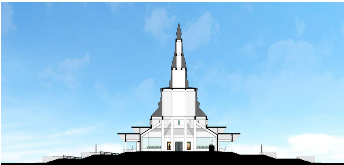
ภาพที่ 4: แสดงรูปตัดภายในแสดงโครงสร้างของอาคารอนุสรณ์สถานพระเทพวิทยาคม