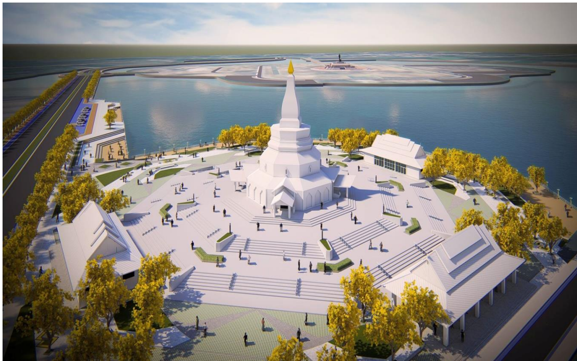
ภาพที่ 5: แสดงทัศนียภาพโดยรวมของอาคารอนุสรณ์สถานพระเทพวิทยาคม