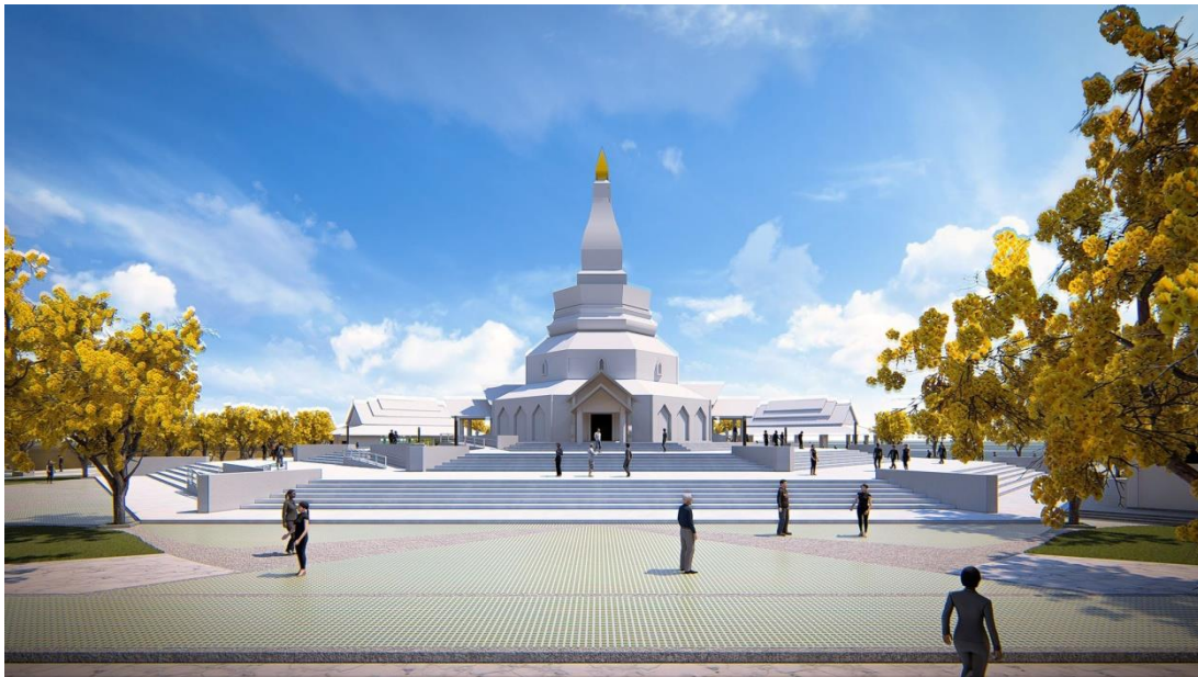
ภาพที่ 3: แสดงทัศนียภาพโดยรวมของอาคารอนุสรณ์สถานพระเทพวิทยาคม