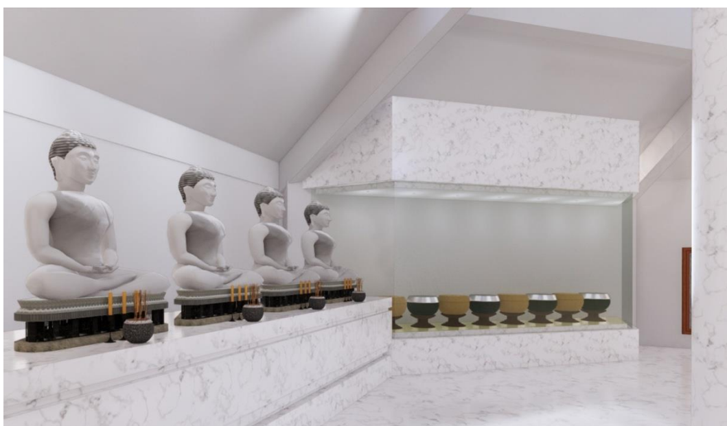
ภาพที่ 7: แสดงทัศนียภาพภายในของอาคารอนุสรณ์สถานพระเทพวิทยาคม